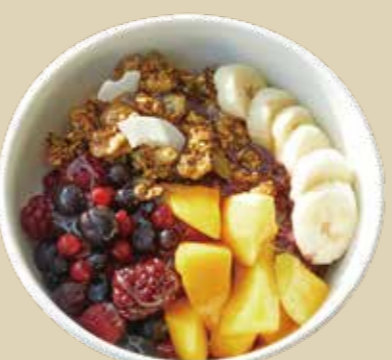
9 アサイーボウル 1600 Acai Bowl 季節のフルーツ、フレッシュバナナ、自家製グラノーラをトッピングしたのアサイーボウル。