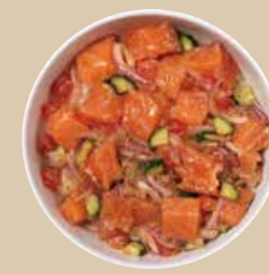
ロミサーモン Lomi Salmon 特製ダレで揉み込んだロミロミサーモン。