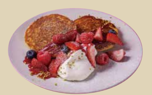
13 ベリーベリーパンケーキ 1400 Berry Berry Pancake (アレルギー：卵、小麦、乳)