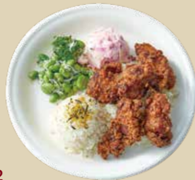
2 モチコチキン 1500 Mochiko Chicken もち粉の衣を使ったハワイアンフライドチキン。海苔やゴマを使い香ばしく仕上げました。 (アレルギー：卵、小麦、乳、えび)