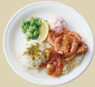
1 ガーリックシュリンプ 1600 Garlic Shrimp カフクで食べたぶりぶりの海老を再現したガーリックシュリンプ。 (アレルギー：卵、小麦、乳、えび)