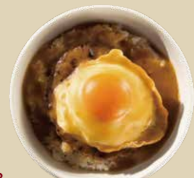
8 ロコモコ 1500 Loco Moco 粗く挽いた牛肉を使用した肉々しいハンバーグにオリジナルグレービーソース。 (アレルギー：卵、小麦、乳)