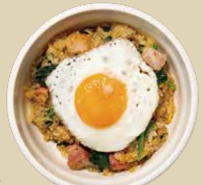
7 パパスフライドライス 1400 Papas Fried Rice 砂糖醤油で炒めたローカル人気のハワイアンフライドライス。 (アレルギー：卵、小麦、乳)