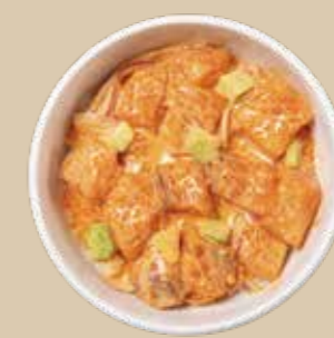
スパイシーサーモン Spicy Salmon シラチャーマヨベースでピリッと辛いサーモン。