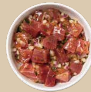
アヒデラックス Ahi Deluxe ごま油、ガーリックで絡めた塩ベースのアヒ。