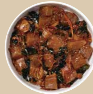
アヒショウユ Ahi Shoyu たまり醤油で和風に仕上げたアヒ。