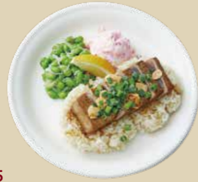
5 ガーリックアヒステーキ 1700 Garlic Ahi Grill Plate アヒを焼きガーリックバター醤油で味付けしたボリューム満点なプレート。 (アレルギー：卵、小麦、乳)