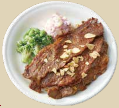
4 ガーリックカルビ 1800 Garlic Kalbi 大判の牛肉を特製のガーリックソースで焼き上げた食べ応えのある一品。 (アレルギー：卵、小麦、乳)