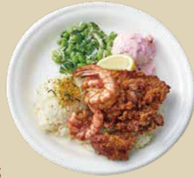
3 シュリンプ & モチコチキン 1700 Garlic Shrimp / Mochiko Chicken 人気のガーリックシュリンプとモチコチキンのミックスプレート。 (アレルギー：卵、小麦、乳、えび)