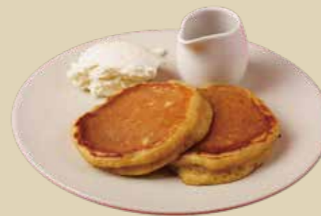
11 バターミルクパンケーキ 1200 Buttermilk Pancakes (アレルギー：卵、小麦、乳)