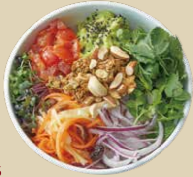
6 アロハサラダボウル 1600 Aloha Salad Bowl キアヌにトマト、アボカド、パクチー、ミント、キャロットラベなどの野菜とさまざまなナッツを中心に栄養バランスの取れたオリジナルサラダボウル。 (アレルギー：卵、小麦、乳)