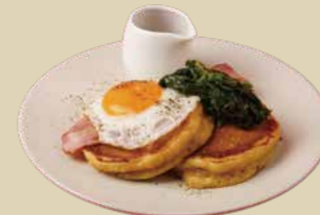
12 ベーコンエッグパンケーキ 1400 Bacon Egg Pancake (アレルギー：卵、小麦、乳)