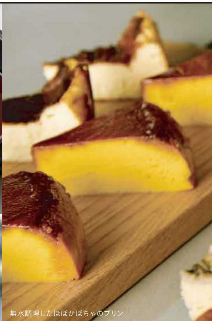
無水調理したほぼかぼちゃのプリン