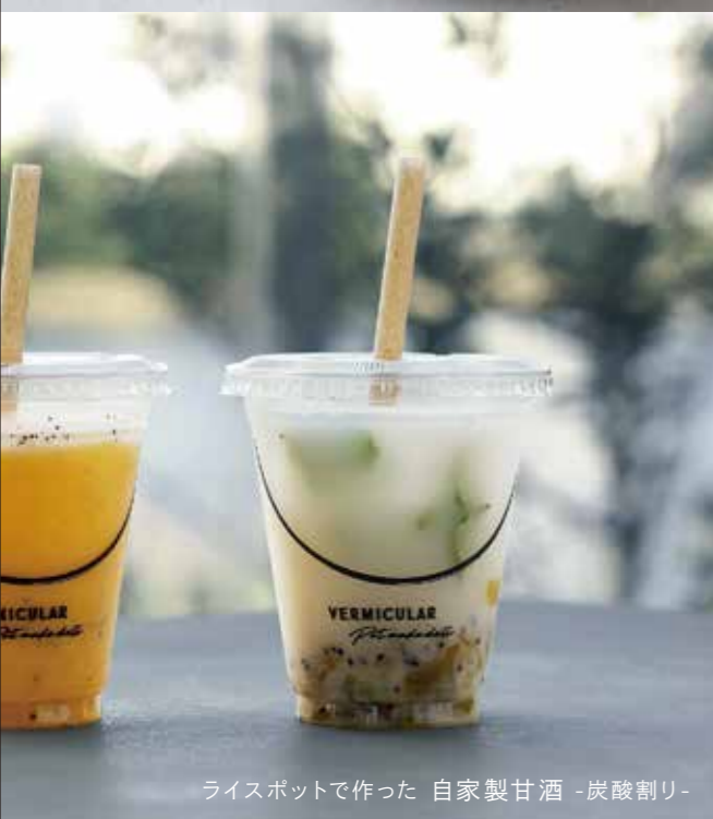
ライスポットで作った 自家製甘酒 -炭酸割り-