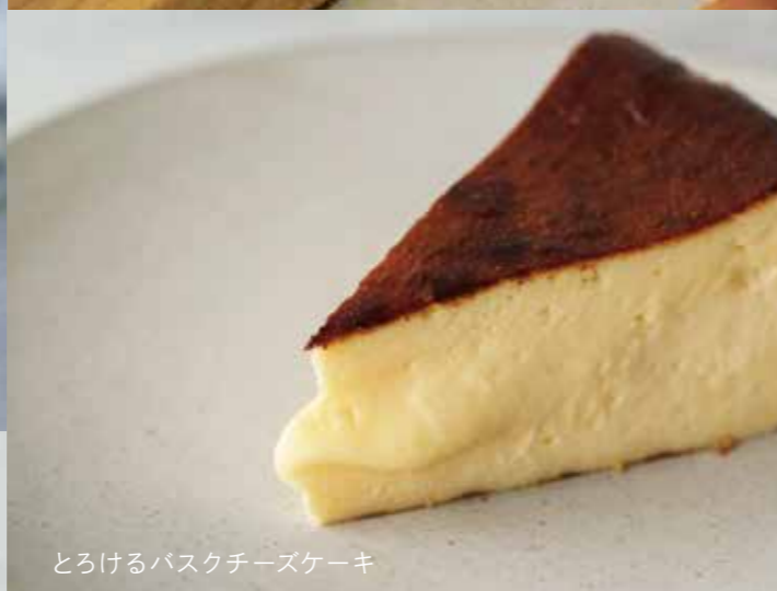
とろけるバスクチーズケーキ