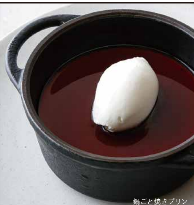
鍋ごと焼きプリン