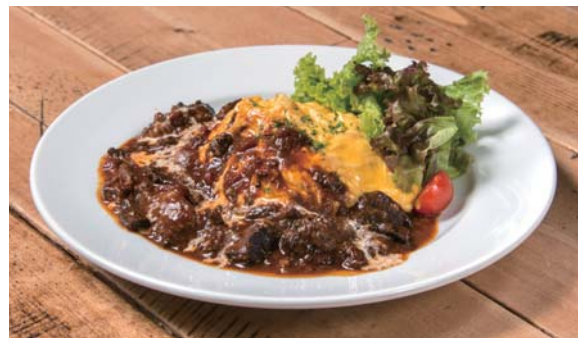
PLATE & RICE